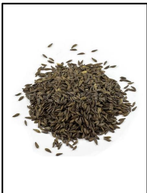
Imagem da semente